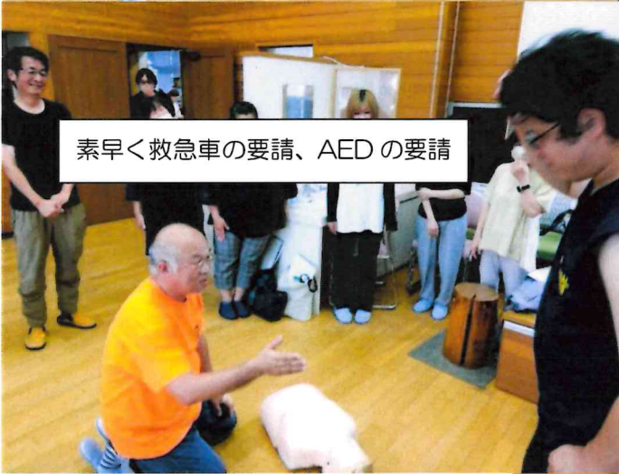
素早く救急車の要請、AEDの要請