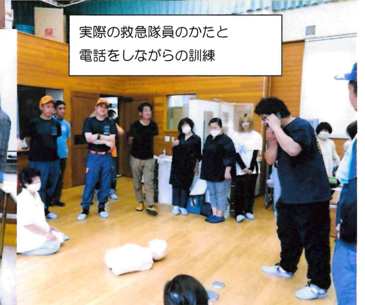
実際の救急隊員のかたと 電話をしながらの訓練

救急救命講習では実際の救急隊員の方と電話で指示を受けながら訓練をしました。本番さながらの緊張感もあり、非常に満足度の高い研修となりました。実際、後日談としてある職員が道に倒れているおばあさんを発見され、近所の方にもお願いする等今回の体験を教訓に対応ことができました。そういったエピソードを聞くと研修をやった甲斐があったと思いました。今後も身になる研修を計画していきたいと思います。