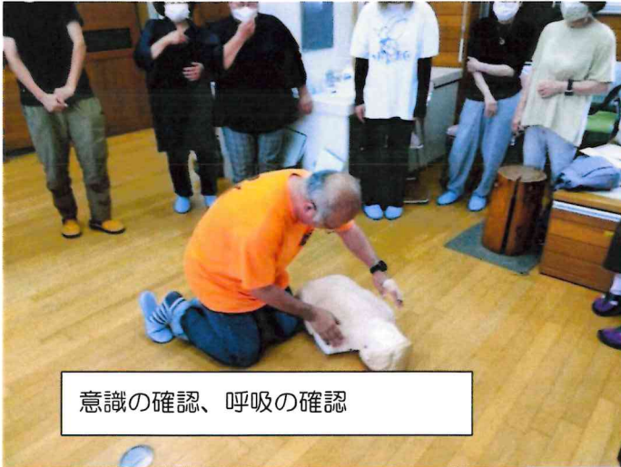
意識の確認、呼吸の確認