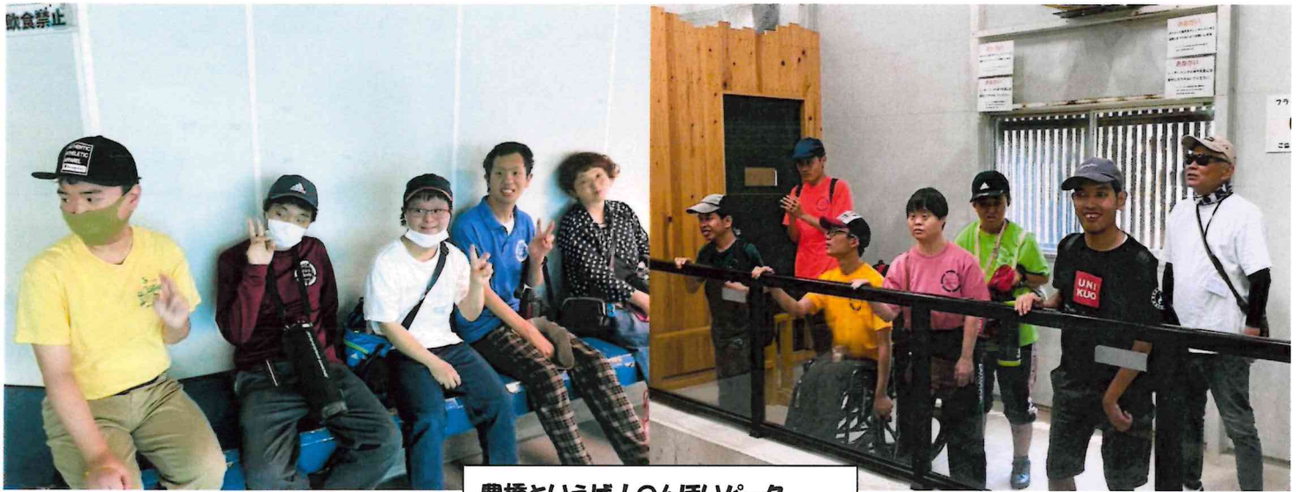
豊橋といえば! のんほいパーク